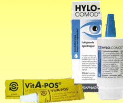
איור 2 Hylo-Comod + VitA-POS

כידוע היום הטיפול בעין היבשה מחייב התייחסות לגורמי המחלה ולא רק לסימפטומים. ההכרה בחלקה של הדלקת כגורמים לעין היבשה, מביאה למסקנה שיש צורך בטיפול נוגדי דלקת במחלת העין היבשה. 1,2