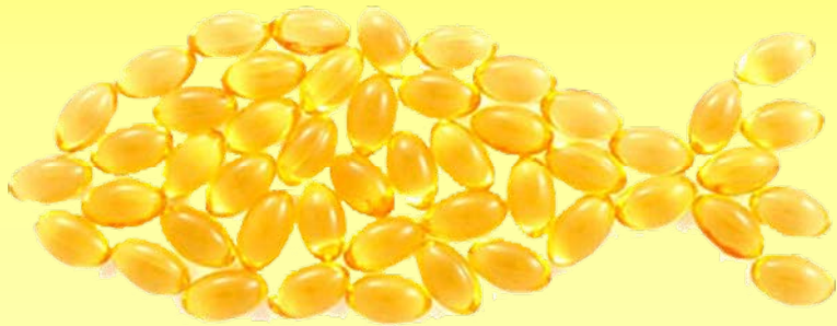
איור 3 3 omega

העדשות האלו נותנות תחושה נעימה לעין, פי 7 יותר חמצן, ודוחות משקעים. העדשות שנבחרו הן עדשות סליקון חד פעמיות, ל-3 חודשים, בעלות דיוק גבוה. הומלץ לה על טיפול סיסטמי לעין היבשה, כי היום טיפול זה מביא תוצאות מהירות. 1,2